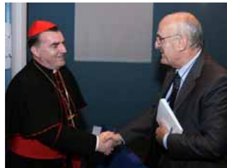
Veleposlanik Fuentes s kardinalom Josipom Bozanićem, nadbiskupom zagrebačkim, na početku konferencije.

1946. Godine 1951. stavljen je u kućni pritvor do svoje preuranjene smrti 1960. godine.