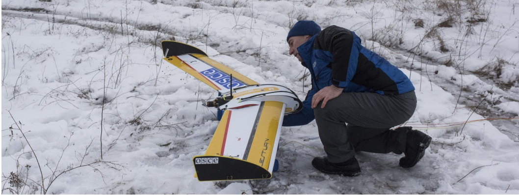
Спостерігач СММ готує до запуску БПЛА в Луганській області