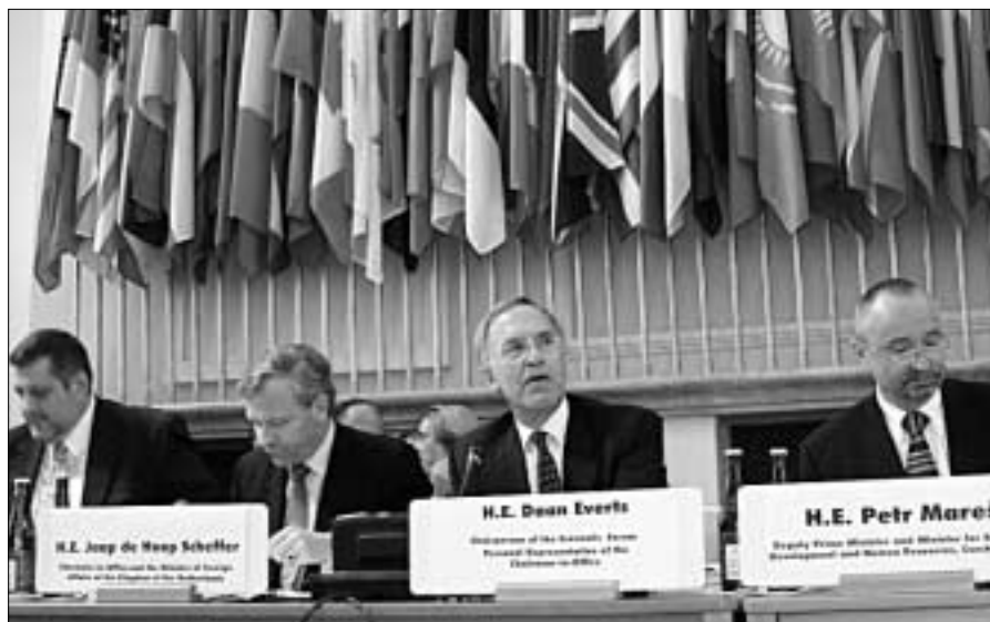
На Экономическом форуме подчеркивалась роль деловых кругов в борьбе со всеми видами незаконного оборота.

«Данный регион [ОБСЕ], как и очень многие другие, нуждается в безопасности в качестве условия процветания», – заявил директор Управления ООН по наркотикам и преступности Антонио Мария Коста. В своем основном докладе он подчеркнул, что такие социальные бедствия, как организованная преступность и слаборазвитость, взаимно усиливают друг друга: «Государства, страдающие от этих проблем, имеют мало шансов построить у себя процветающее демократическое общество. В свою очередь, слаборазвитость