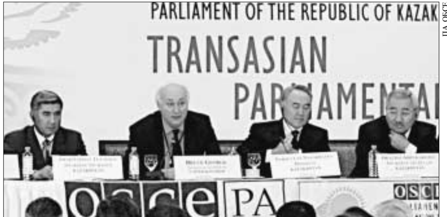
Председатель ПА Брюс Джордж (второй слева) и президент Казахстана Нурсултан Назарбаев (третий слева) открывают Трансазиатский парламентский форум.

По завершении обсуждений, проходивших в здании швейцарского парламента в Берне 14–15 мая, более 80 парламентариев из 30 государств – участ-