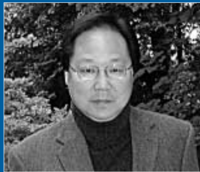
Руководитель Антитеррористической группы Брайан Ву.

По словам Б. Ву, 2002 год был отмечен впечатляющей серией успехов в борьбе с терроризмом, в том числе в странах ОБСЕ. Заметно – на 44% – сократилось число террористических актов, которых за предыдущий, 2001 год во всем мире было зарегистрировано 355% если в 2001 году от рук террористов погибло 3 295 человек, то в 2002 году число жертв снизилось до 717% количество раненых при этом составило менее 2 000 человек, по сравнению с 2 283 в 2001 году.