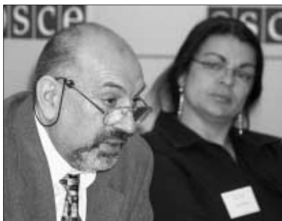
Советник БДИПЧ по делам рома и синти Николае Георге и лидер синти Лалла Вайс.

Войны на Балканах и расширение Европейского союза привлекли внимание к положению многочисленных рома и синти в странах Центральной и Восточной Европы, проблемы которых игнорировались в течение долгого времени. Однако отсутствие необходимой координации и продуманных стратегических подходов привело к тому, что щедрая помощь, оказанная за последние десять лет готовыми к сочувствию и пониманию донорами, не принесла оптимальных результатов.