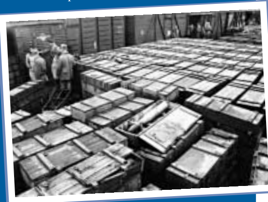
Миссия ОБСЕ в Молдове

23 апреля мне довелось сопровождать наших военных сотрудников в ходе одного из проводившихся ими контрольных