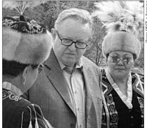
Личный представитель Марти Ахтисаари с музыкантами на официальном приеме в Кыргызстане.

Лейтмотивом всех встреч являлись региональное сотрудничество и выгоды от развития добрососедских отношений. Личный представитель отмечал, что более эффективный пограничный режим и свободное передвижение товаров, капиталов, услуг и граждан весьма способствовали бы расширению торговых связей, созданию новых инвестиционных возможностей и улучшению отношений между жителями стран регио-