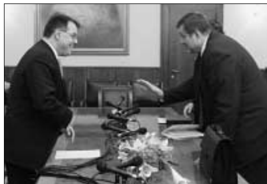
Заместитель премьер-министра Сербии Небойша Чович и Генеральный секретарь ОБСЕ Ян Кубиш.

Генеральный секретарь выступил на 112-й сессии Комитета министров