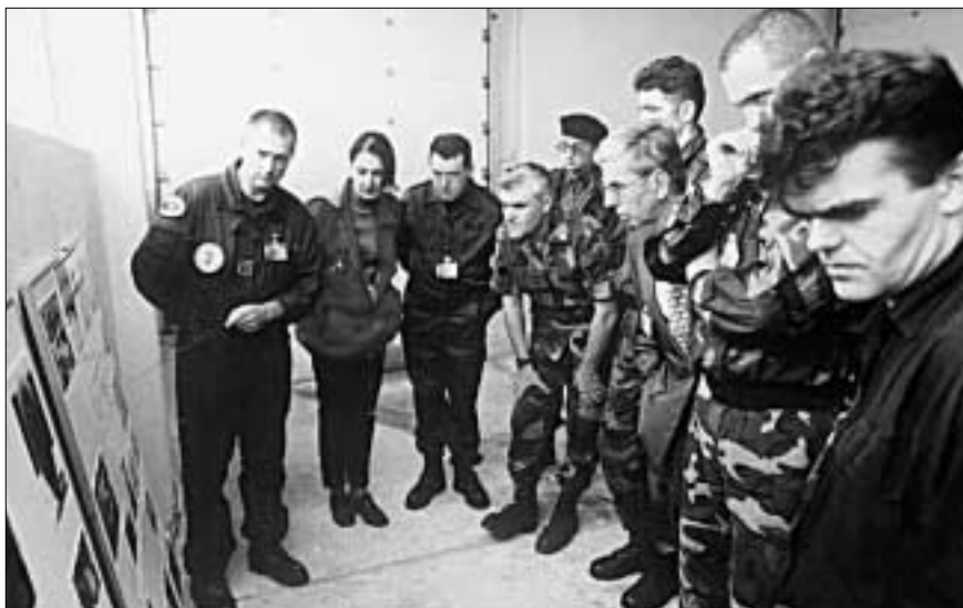
Миссия ОБСЕ в БИГ

И именно в тот момент, когда мы боролись с последствиями использования системы подбора персонала,