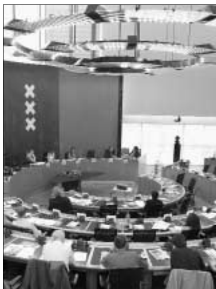
В здании амстердамской ратуши состоялась дискуссия на темы Интернета и свободы СМИ.

Однако технические возможности Интернета могут использоваться не только теми, кто стремится уйти от цензуры, но и теми, кто эту цензуру осуществляет. Действительно, по мере того, как популярность Интернета растет, эта относительно новая и на первый взгляд неорганизованная среда обретает собственную структуру, механизмы регулирования и классификацию. Правительства, компании и владельцы авторских прав – лишь немно-