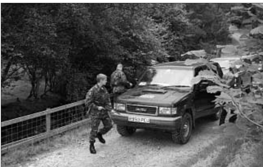
Британские кандидаты на прикомандирование отрабатывают действия в «нештатной» ситуации в Сеннибридже (горный район Уэльса).

Сейчас работа системы налажена довольно неплохо, и она позволяет отсеять тех, кто не умеет обращаться с компьютером. Используя таблицу РЕАКТ с описанием должностных