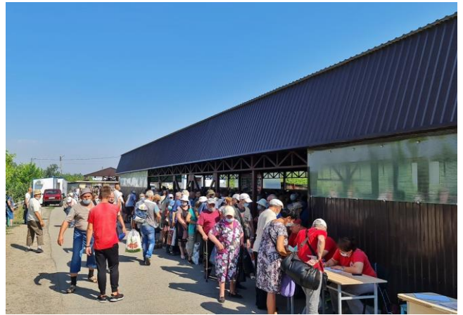
Мирні жителі перетинають відповідний блокпост збройних формувань південніше мосту біля Станиці Луганської в Луганській області, серпень 2021 р.

чоловік (70–79 років) на відповідному блокпості збройних формувань південніше мосту біля Станиці Луганської, травень 2021 р.