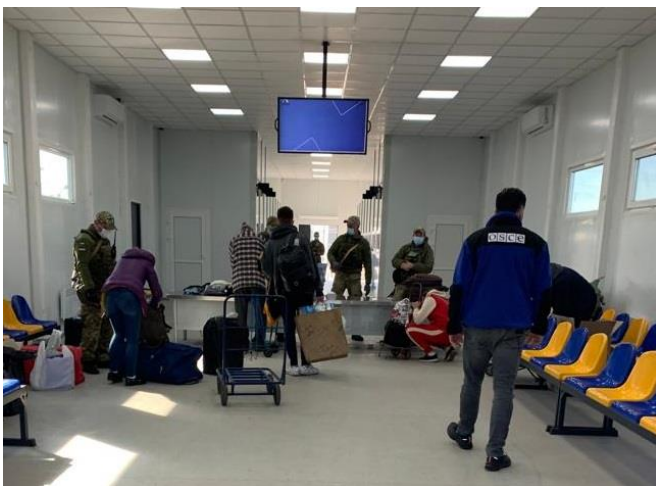
Мирні жителі на КПВВ біля підконтрольної урядові Станиці Луганської в Луганській області, жовтень 2021 р.

Серед 378 цивільних осіб, з якими поспілкувалися спостерігачі, зі 258 співрозмовниками (174 жінками та 84 чоловіками різного віку) розмови проводилися в пунктах пропуску, де вони пояснили причини їхнього