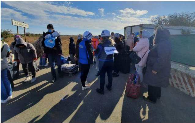
Співробітники СММ ОБСЄ спілкуються з мирними жителями на відповідному блокпості збройних формувань біля непідконтрольної урядові Оленівки в Донецькій області, жовтень 2021 року.

Крім цього, як пояснювали цивільні особи, іноді було важко вийти на зв'язок зі збройними формуваннями, щоб отримати «дозвіл» на перетин. Деякі розповіли, що вказані телефонні номери не працювали, якщо дзвінок робився з підконтрольних урядові районів, а відтак вони не могли далі планувати перетин лінії зіткнення.