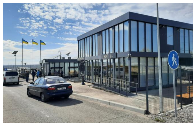
Модульні центри надання адміністративних послуг на КПВВ біля підконтрольного урядові Щастя Луганської області, жовтень 2021 р.

На КПВВ у Щасті, за спостереженнями Місії, було 14 кабінок для перевірки документів, 1 намет ДСНС України, бомбосховище