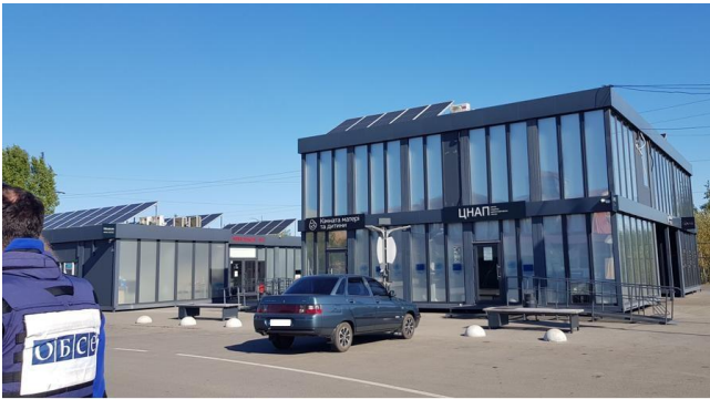
Модульні центри надання адміністративних послуг на КПВВ біля підконтрольного урядові Новотроїцького Донецької області, жовтень 2021 р.

Протягом звітного періоду Місія відзначила, що на КПВВ в Щасті та біля Новотроїцького встановили 2 модульні центри надання адміністративних послуг, які відкрилися 10 листопада та 16 грудня 2020 року відповідно. Зазначені центри — це простір, де в одному місці цивільні особи можуть отримати адміністративні, медичні та інші види послуг, а також відвідати санітарні приміщення. У грудні 2020 року Міністерство з питань реінтеграції тимчасово окупованих територій України оголосило про те, що всі КПВВ уздовж лінії зіткнення будуть облаштовані подібними модульними центрами надання адміністративних послуг 47 . Поза звітним періодом (у жовтні 2021 р.) СММ зафіксувала розгортання будівельних робіт зі зведення модульного центру надання адміністративних послуг на КПВВ у Станції Луганській.