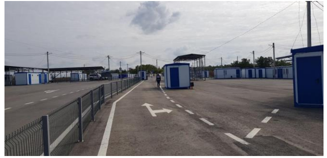
Відповідний блокпост збройних формувань біля непідконтрольної урядові Веселої Гори в Луганській області, жовтень 2021 року.

З моменту, коли в березні 2020 року були введені в дію обмежувальні заходи стосовно здійснення перетинів, пройшло майже 18 місяців. З того часу свобода пересування цивільних осіб була суттєво обмежена, а ДПСУ зафіксувала зменшення кількості перетинів на 95% супроти показників до початку пандемії COVID-19. Особливо різке зменшилася кількість перетинів у Донецькій області, де в період із листопада 2020 року до вересня 2021 року зареєстровано лише 31 тис. перетинів супроти близько 9,36 млн у період із листопада 2018 року до вересня 2019 року. Для цього є дві причини. По-перше, цивільні особи можуть здійснювати перетини лише через два з п'яти пунктів пропуску уздовж лінії зіткнення. Незважаючи на те, що всі 5 контрольовані урядом КПВВ, що раніше працювали, були відкритими, збройні формування відкрили лише блокпости поблизу Оленівки (працює щопонеділка та щоп'ятниці) та південніше мосту біля Станиці Луганської (працює щодня). По-друге, на цивільних осіб також вплинули ускладнені вимоги, які їм необхідно виконати, перш ніж їм дозволять перетнути лінію зіткнення, щоби провідати сім'ю чи отримати необ-