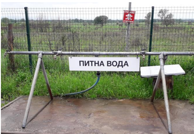
Попереджувальний знак про мінну небезпеку червоного кольору одразу за водогазом із питною водою поблизу КПВВ біля підконтрольної урядові Станиці Луганської в Луганській області, червень 2021 р.

Попри те, що на засіданні Тристоронньої контактної групи 22 липня 2020 року була досягнута домовленість про заходи з посилення режиму припинення вогню, які набули чинності з 27 липня 2020 року, упродовж звітного періоду Місія фіксувала порушення режиму припинення вогню в Донецькій і Луганській областях, серед яких близько 7 000 порушень режиму припинення вогню в радіусі 5 км від пунктів пропуску. Серед зазначених порушень режиму припинення вогню 469 порушення (зокрема 100 вибухів) зафіксовано в радіусі 5 км від пунктів пропуску поблизу Новотроїцьке – Оленівка та в районі Станиці Луганської 38 , а 6 500 порушень (зокрема 816 вибухи) — у радіусі 5 км від пунктів пропуску біля Майорська – Горлівки, Мар'їнки – Кременця та Гнутового – Верхньошироківського, які мирні жителі не могли перетинати впродовж звітного періоду.