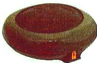
Mina antipersonal modelo P-5