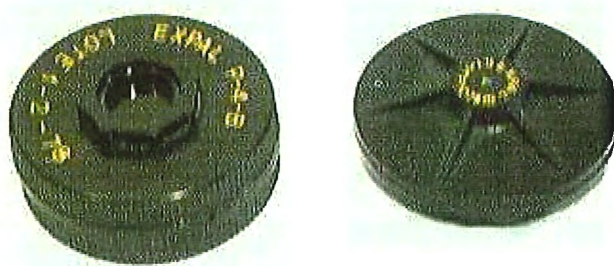
Mina antipersonal modelo P-4 B