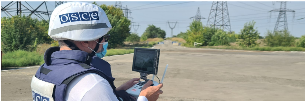
Наблюдатель СММ управляет полетом БПЛА в Луганской области