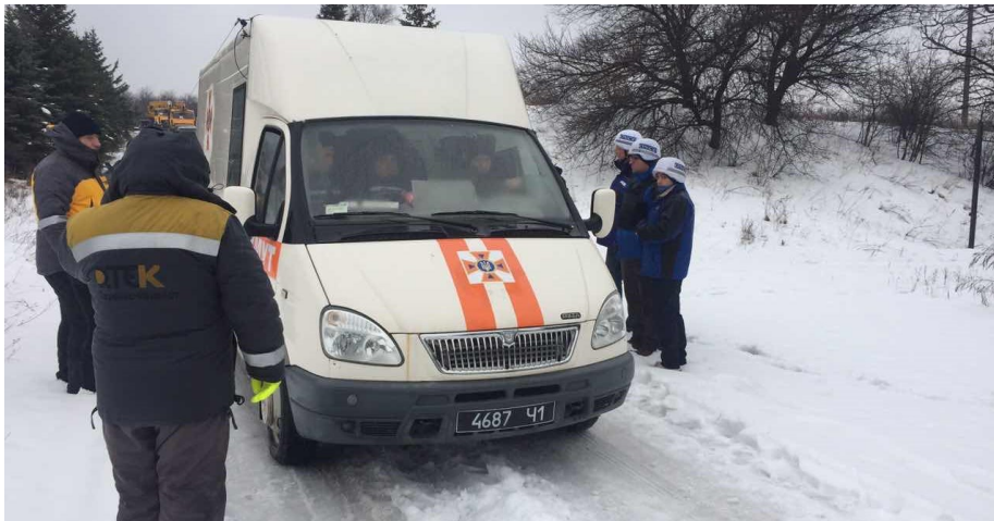
Спостерігачі ОБСЄ на Донецькій фільтрувальній станції сприяють встановленню режиму припинення вогню та здійснюють моніторинг його дотримання з метою забезпечення виконання ремонтних робіт на лініях електропередачі, 4 лютого 2017 року