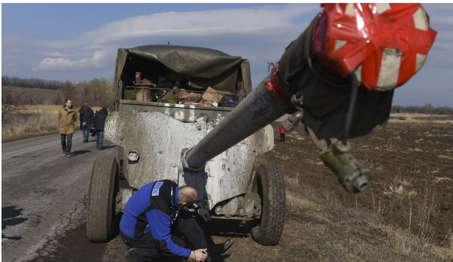
СММ спостерігає за пересуванням важкого озброєння на сході України, лютий 2015 р.