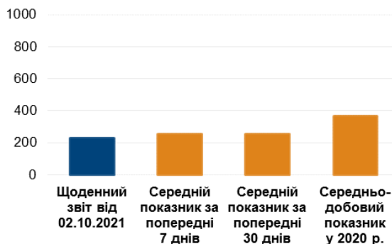
К-ть зафіксованих порушень режиму припинення вогню 3