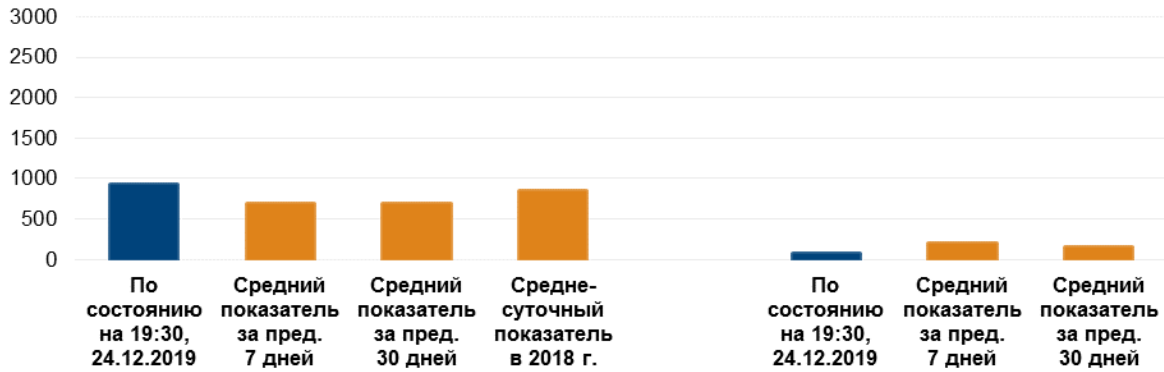
К-во зафиксированных взрывов