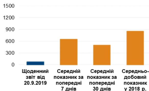
Кількість зафіксованих порушень режиму припинення вогню 2