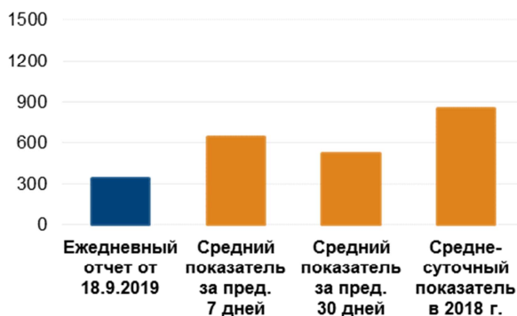
Количество зафиксированных нарушений режима прекращения огня 2