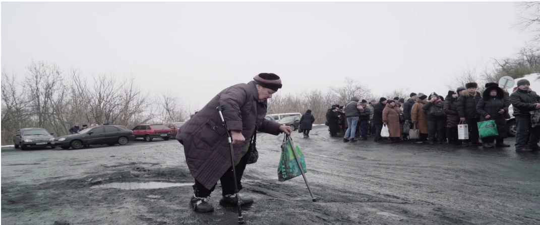
Жінка біля контрольного пункту в'їзду-виїзду поблизу Станції Луганської, Луганська область