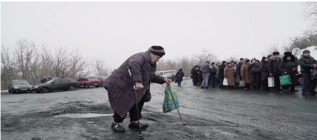
Женщина поблизости контрольного пункта въезда-выезда возле Станции Луганской, Луганская область