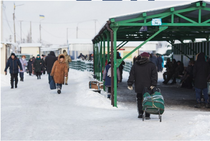
Цивільні особи перетинають контрольний пункт в'їзду-виїзду поблизу Станції Луганської, Луганська область