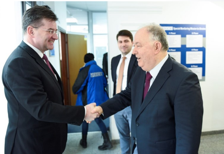
Голова СММ ОБСЄ Ертурул Апакан вітає Чинного голову ОБСЄ Мирослава Лайчака в Головному офісі СММ у Києві